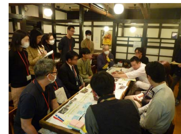
写真 意見交換会の様子