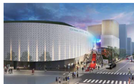
写真 横浜文化体育館メインアリーナ