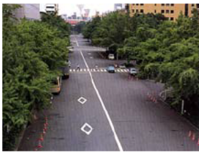
再整備前の日本大通り