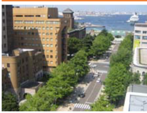
再整備後の日本大通り