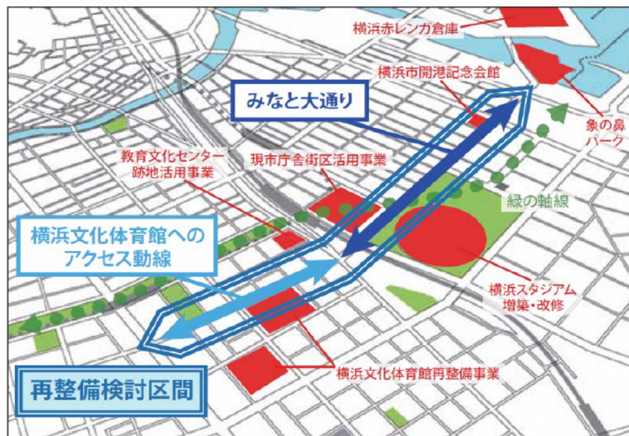
写真 再整備の検討内容（市作成）

そのために、沿道の皆さまとの意見交換を通じて、道路に対するニーズ等を把握し、歩いて楽しいまちづくりを進めたいと考えています。