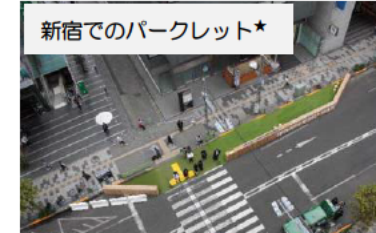
新宿でのパークレット*

社会実験時の歩道の段差やカラーコーンの隙間は高齢者の通行や子供の飛び出し等に配慮する必要がある。